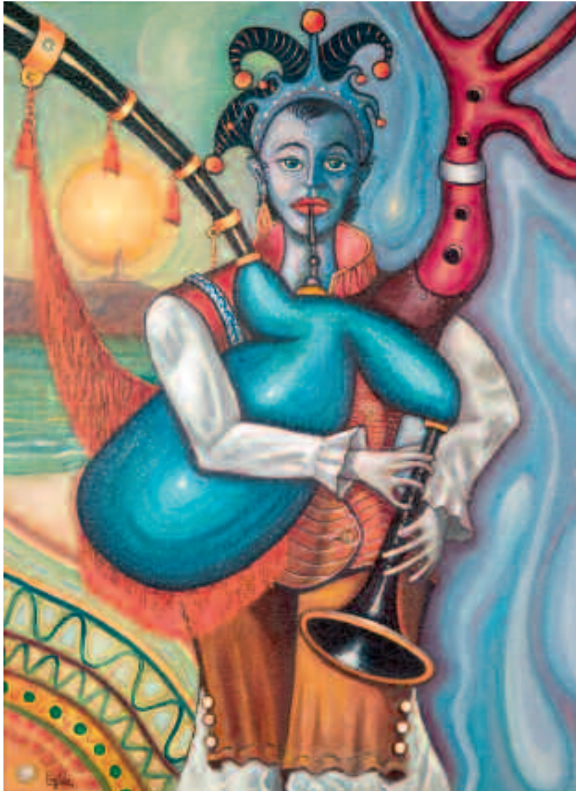
Xenios o gaiteiro Óleo / mixta 105 x 78 cm