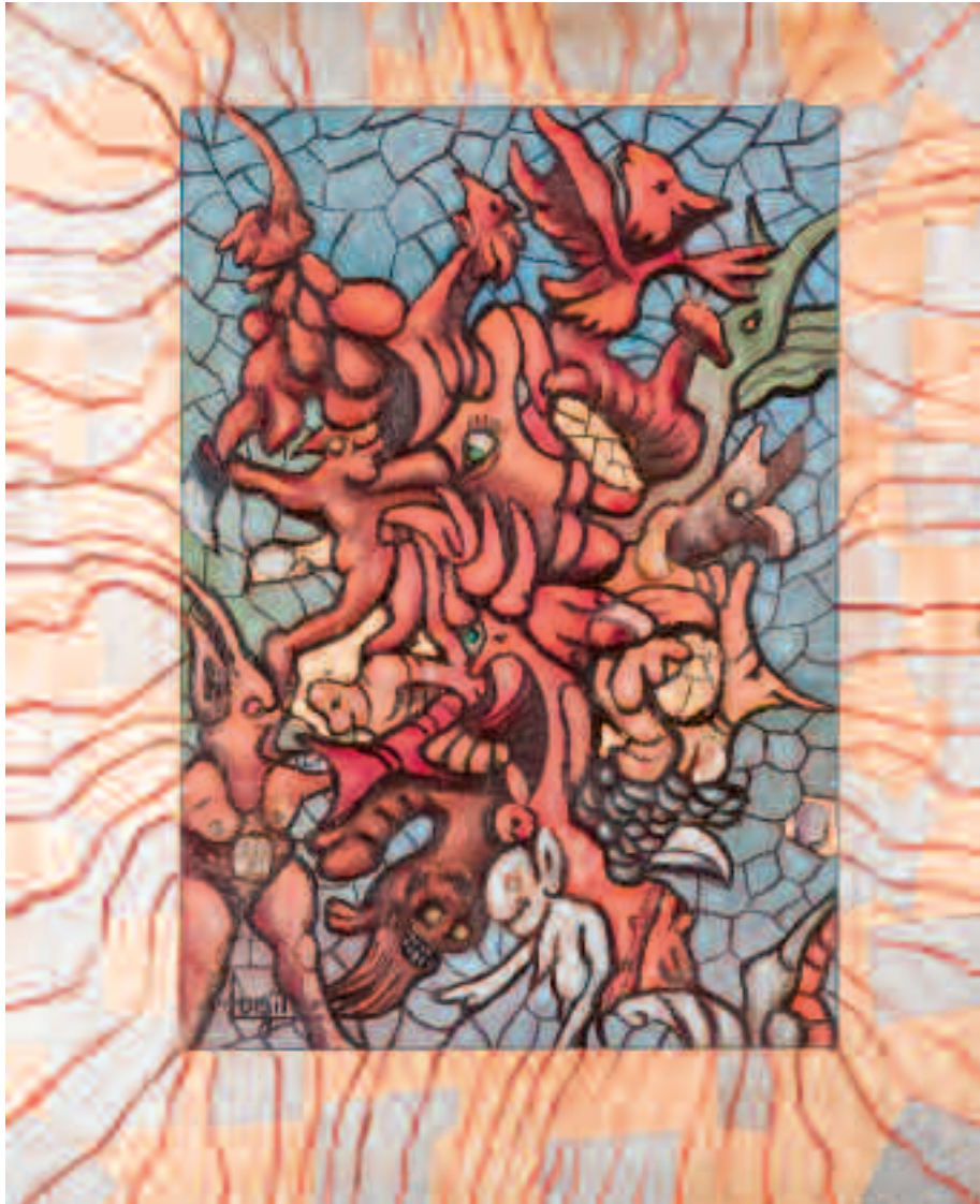
Pijos transgresores Óleo / mixta 47 x 46 cm