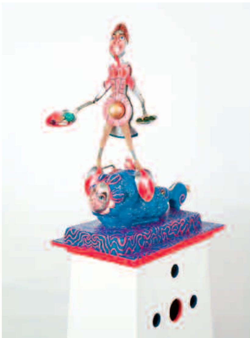
Depredador gilipuerta. Mixta / escultura 150 x 45 x 30 cm