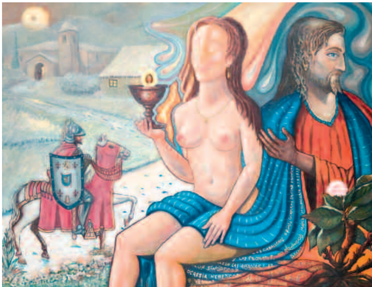
A búsqueda. Acrílico / mixta 92 x 119 cm