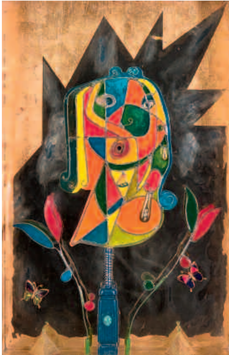
Los gritos del silencio (Homenaje a mujer maltratada)