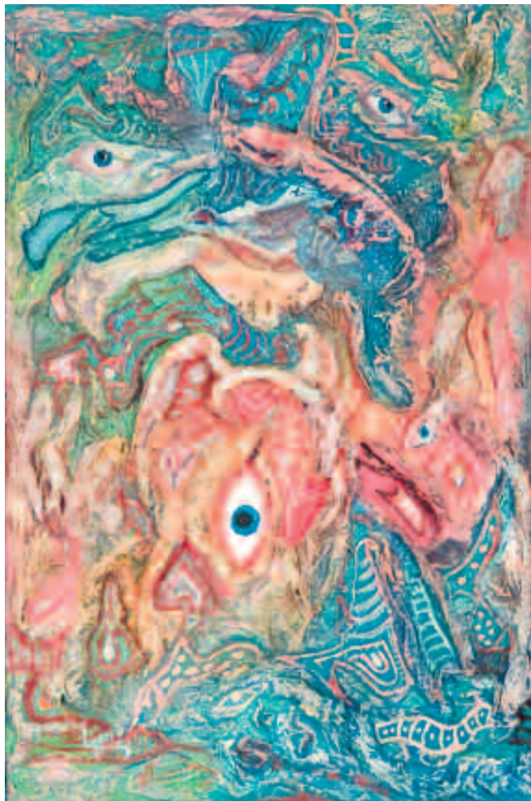
Mira ké rabia Piscis navega por Akuario