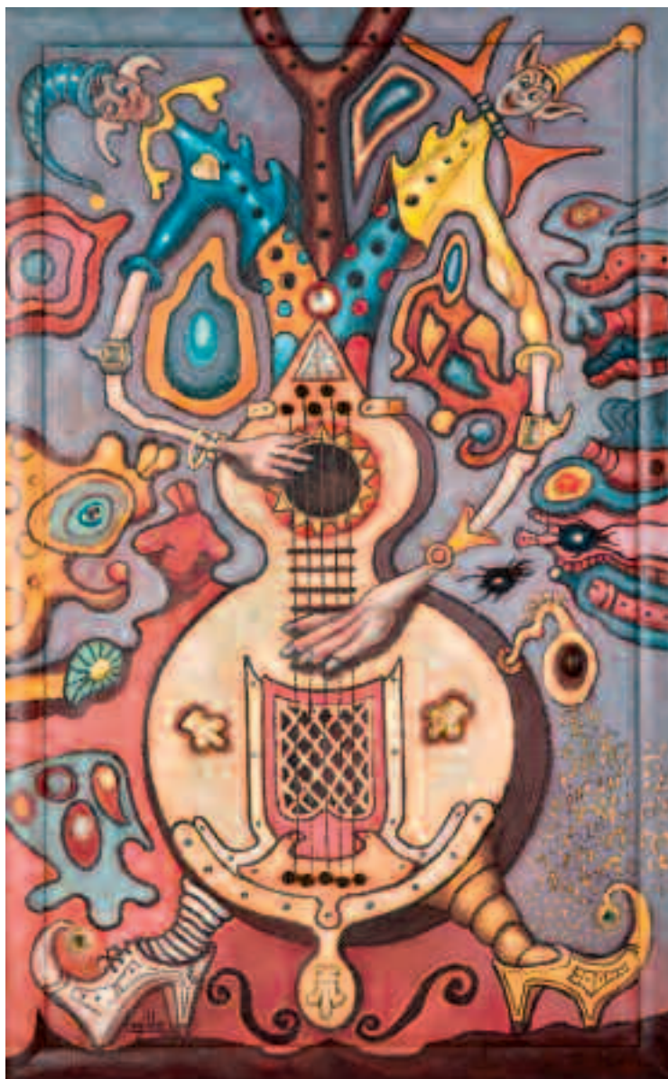
Dualidade musical Óleo / mixta 63 x 40 cm