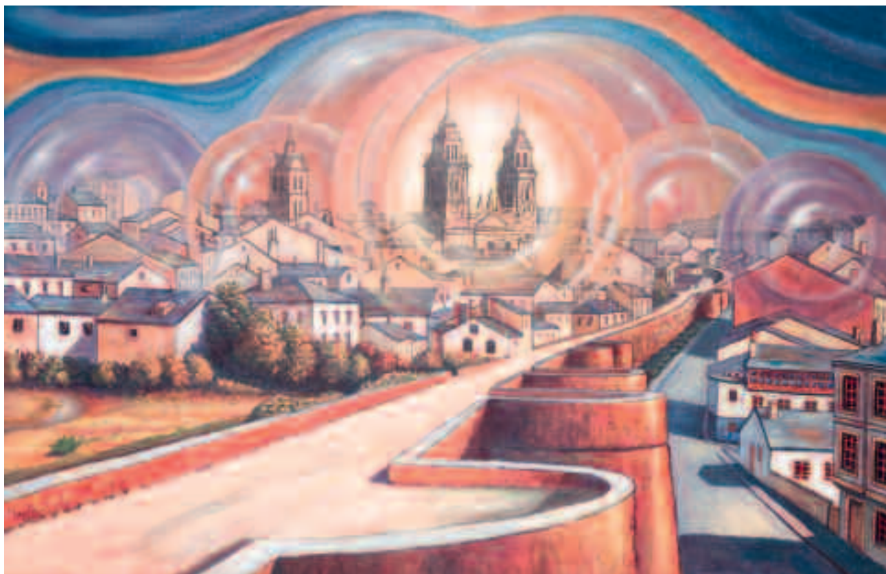
Lukus esferikus Acrílico 80 x 122 cm