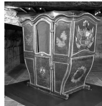
Cadeira de liteira

Neste tipo de pezas fíxose cotiá decoralas con ricas policromías e teas exóticas coma veludos, sedas, brocados ou damascos, nun intento de amosar a riqueza do posuidor do transporte que ata ese momento quedaba fóra do ollo alleo nas residencias privadas. Todo isto obrigou á Corte a editar numerosas pragmáticas contra o luxo nas que se limitaba toda esa ostentación.