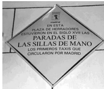
Placa concello de Madrid

Os transportadores debían levar sempre visibles unhas correas de cor azul postas aos ombros que servían coma distintivo de que ese era un transporte público.