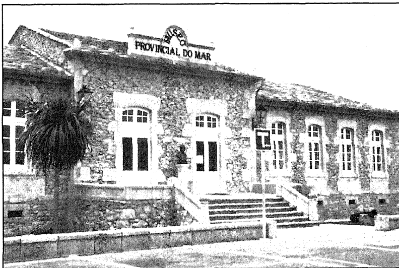
Fachada Museo Provincial do Mar

Durante siglos San Ciprián fue un importante puerto pesquero y toda la vida del pueblo giraba en torno al mar, y aunque hoy ya no sean los recursos marinos la base fundamental de su economía, conserva aún todo el encanto de pueblo marinero. Esto explica en buena medida que con este Museo se rinda homenaje al mar, exhibiendo la historia, tradiciones y útiles de la navegación y de la pesca, así como una buena muestra de la riqueza biológica marina.