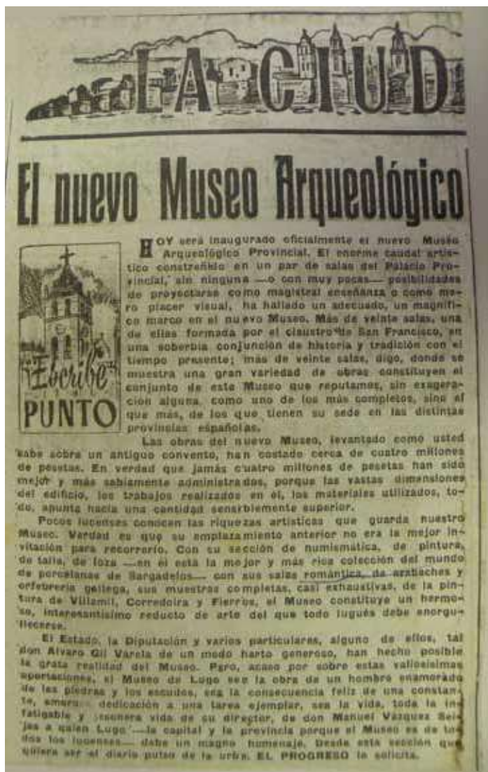
Fig. 6. Extracto del periódico El Progreso del 19-9-1957.

alterados y la información que nos ha llegado del origen de estas primeras piezas que se incorporan al Museo es escasa, sesgada e incluso poco fiable. Otras formas de ingreso, según el libro de registro del MPL, son las adquisiciones y los depósitos. Las cesiones también eran intermediadas o conducidas por los miembros de la Junta Rectora del Museo que promovían las gestiones necesarias para incrementar los fondos predicando con el ejemplo.