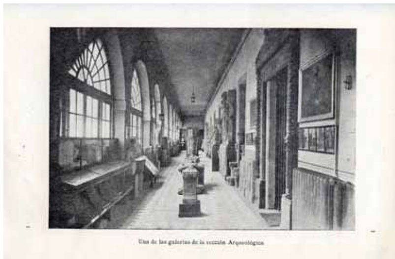
Fig. 3. Primera ubicación del MPL en el pazo de San Marcos.