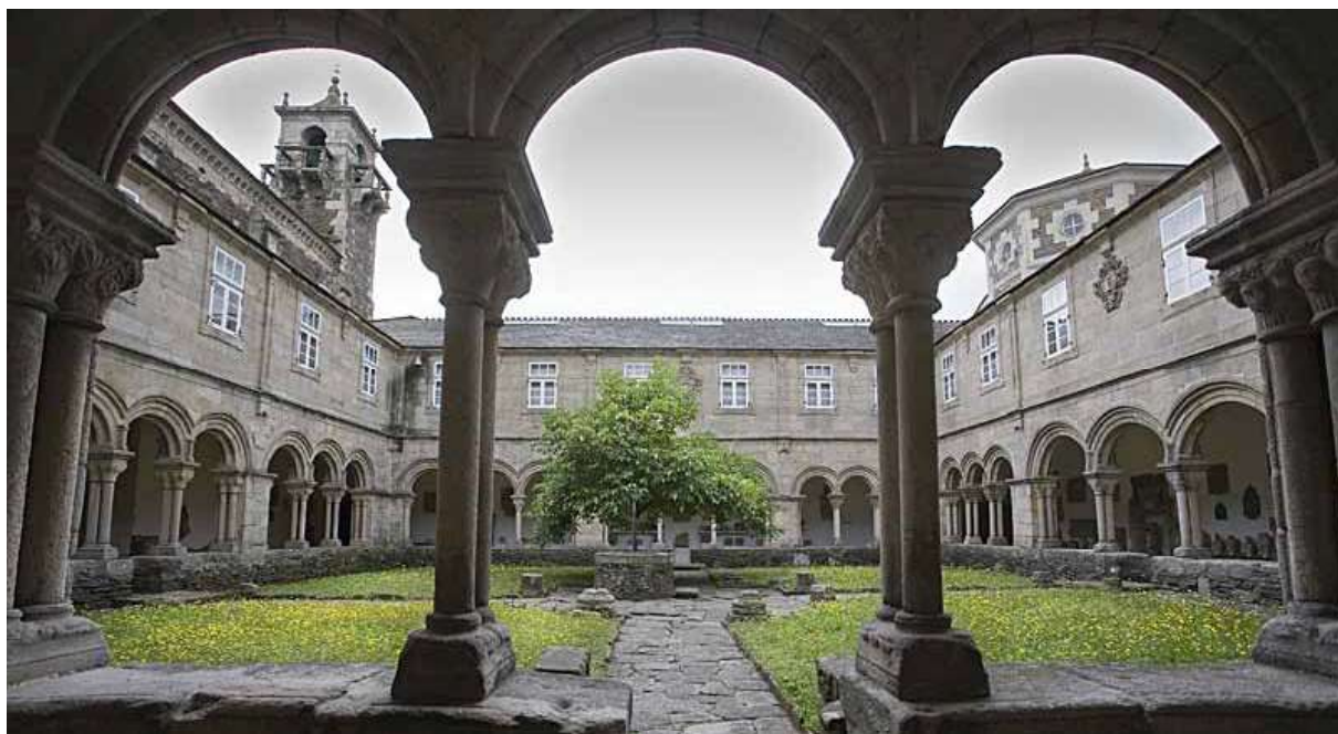
Fig. 8. Claustro interior del Museo Provincial de Lugo.