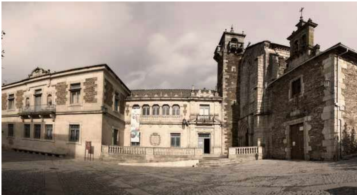
Fig. 7. Fachada principal actual del Museo Provincial de Lugo.

A través de esta peculiar iniciativa se incrementa también la colección de arqueología entre los años 1973 a 1979 con un total de sesenta y dos entradas en el libro de registro 12 .