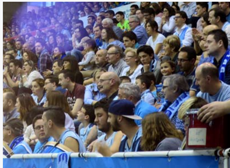
Afición do Breogán durante un partido no Pazo dos Deportes de Lugo

emocionados/a través dun proxecto expositivo que amose a traxectoria histórica e social do Club Baloncesto Breogán, un dos clubs de baloncesto máis relevantes do panorama nacional, e que este ano celebra o seu 50 aniversario.