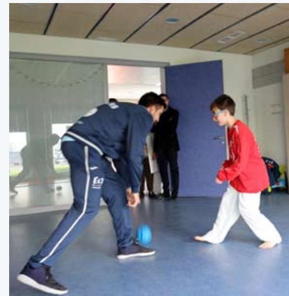
Visita dos xogadores aos nenos e nenas no Hospital Universitario Lucus Augusti

tamén quere inducir á práctica saudable e lúdica da actividade deportiva.