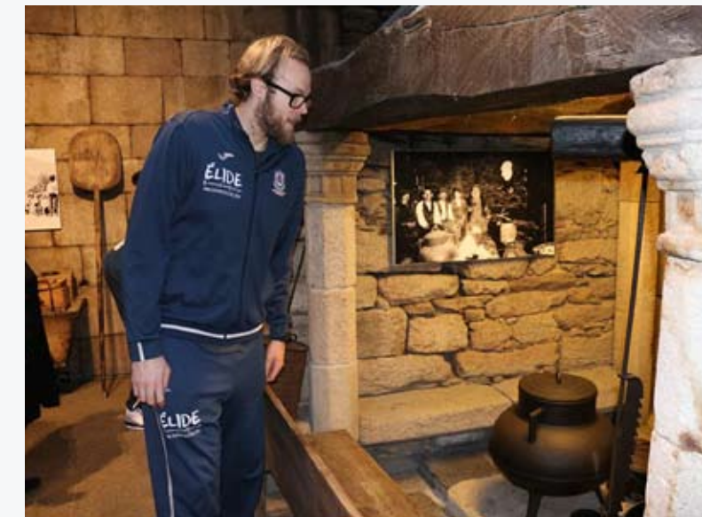
Visita dos xogadores ao Museo Fortaleza San Paio de Narla

toda a loxística do espazo museístico xerado, para poder seguir creando novas exposicións atractivas e innovadoras para o público xuvenil.